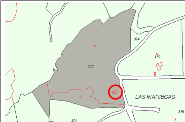
Plano de Catastro (Junio2010). E: 1/5000