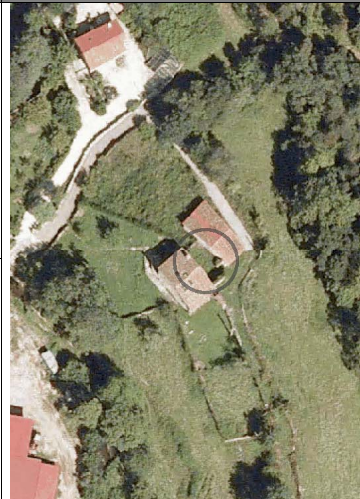
Plan Nacional de Ortofotografía Aérea ( PNOA 2007 ). E:1/1000