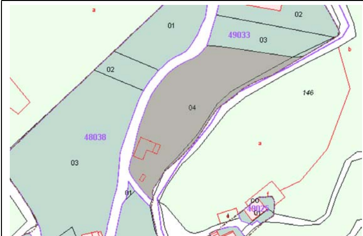
Plano de Catastro (Junio2010). E: 1/3000