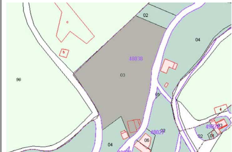
Plano de Catastro (Junio 2010). E: 1/3000