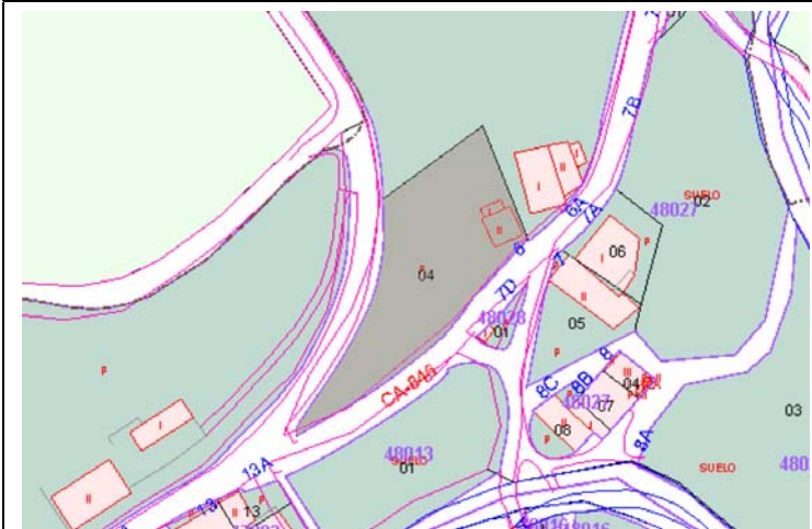
Plano de Catastro (Junio 2010). E: 1/2000