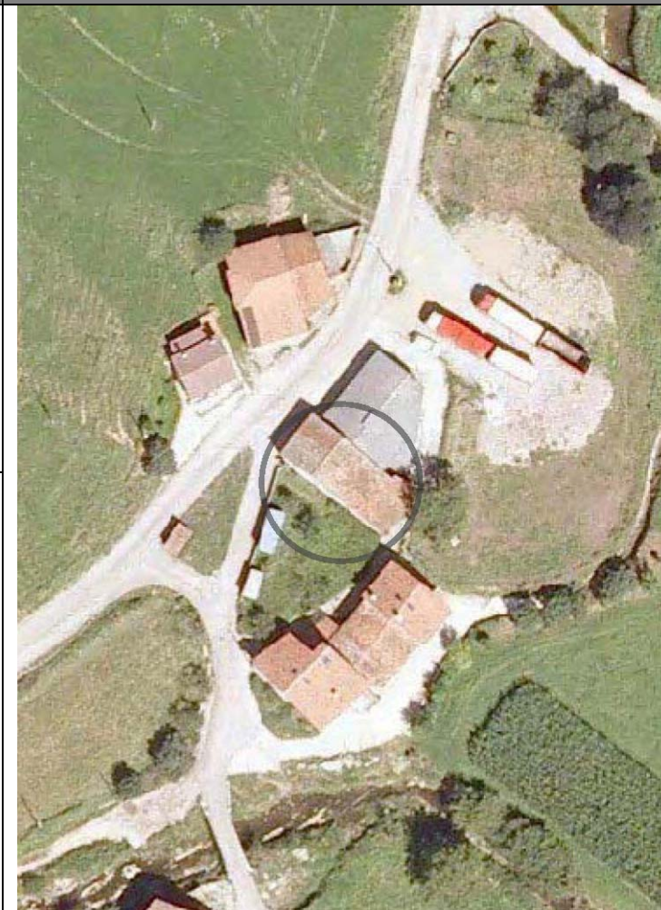
Plan Nacional de Ortofotografía Aérea (PNOA 2007). E:1/1000