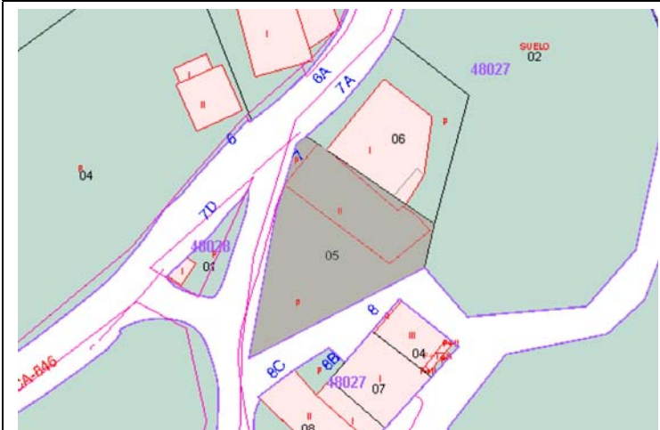
Plano de Catastro (Junio 2010). E: 1/1000