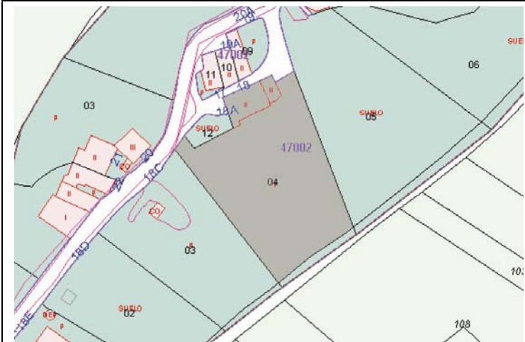
Plano de Catastro (Junio2010). E: 1/2000