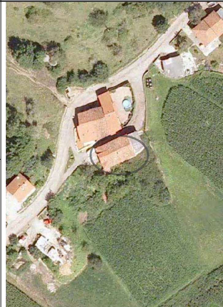
Plan Nacional de Ortofotografía Aérea ( PNOA 2007 ). E:1/1000