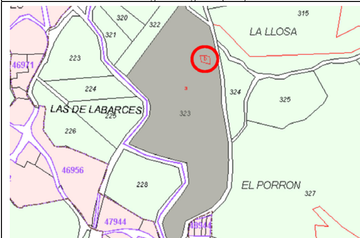
Plano de Catastro (Junio2010). E: 1/5000