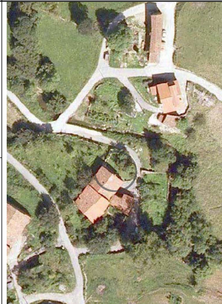
Plan Nacional de Ortofotografía Aérea (PNOA 2007). E:1/1000