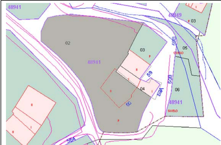
Plano de Catastro (Junio2010). E: 1/1000