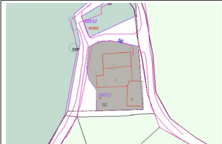
Plano de Catastro (Junio 2010). E: 1/1000