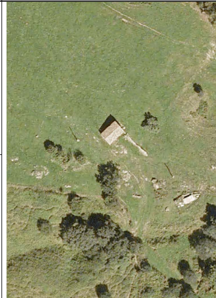
Plan Nacional de Ortofotografía Aérea ( PNOA 2007 ). E:1/1000