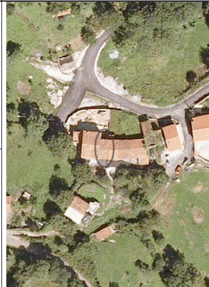
Plan Nacional de Ortofotografía Aérea ( PNOA 2007 ). E:1/1000