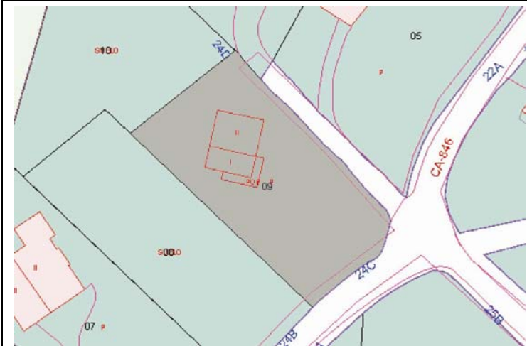
Plano de Catastro (Junio2010). E: 1/1000