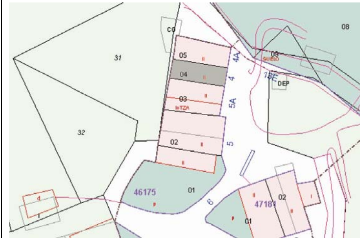
Plano de Catastro (Junio2010). E: 1/1000