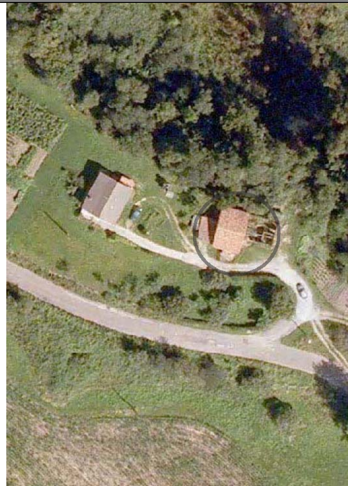
Plan Nacional de Ortofotografía Aérea ( PNOA 2007 ). E:1/1000