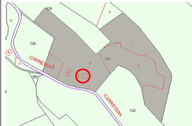
Plano de Catastro (Junio2010). E: 1/5000