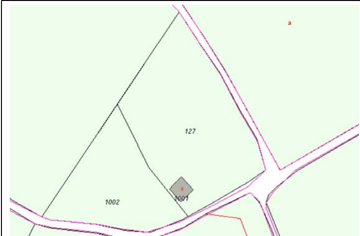
Plano de Catastro (Junio2010). E: 1/2000