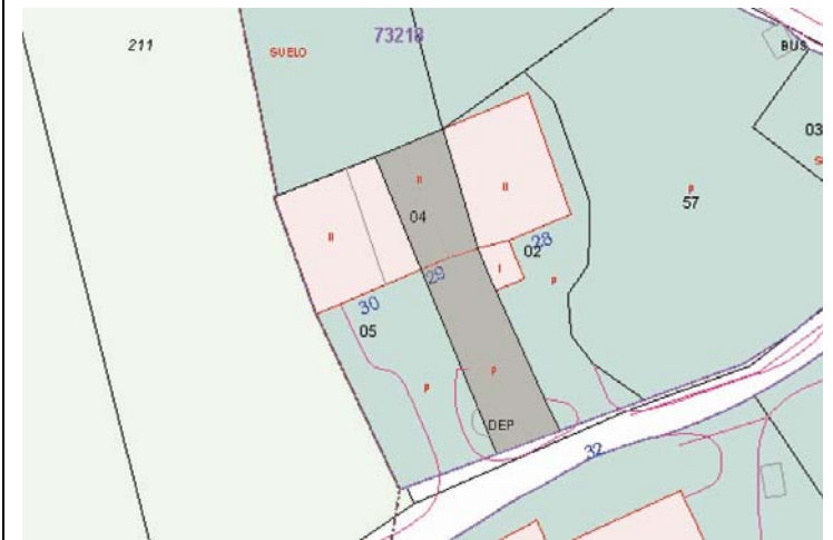
Plano de Catastro (Junio2010). E: 1/1000