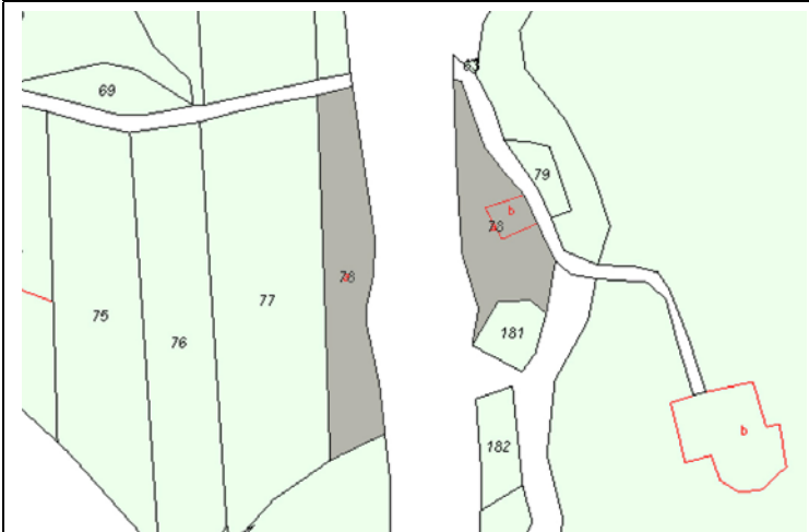
Plano de Catastro (Junio2010). E: 1/3000