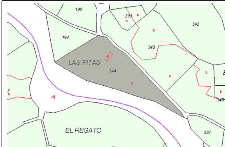
Plano de Catastro (Junio 2010). E: 1/5000