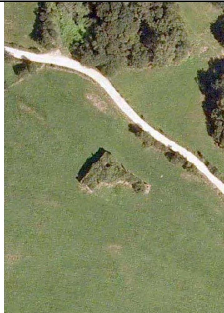
Plan Nacional de Ortofotografía Aérea (PNOA 2007). E:1/1000