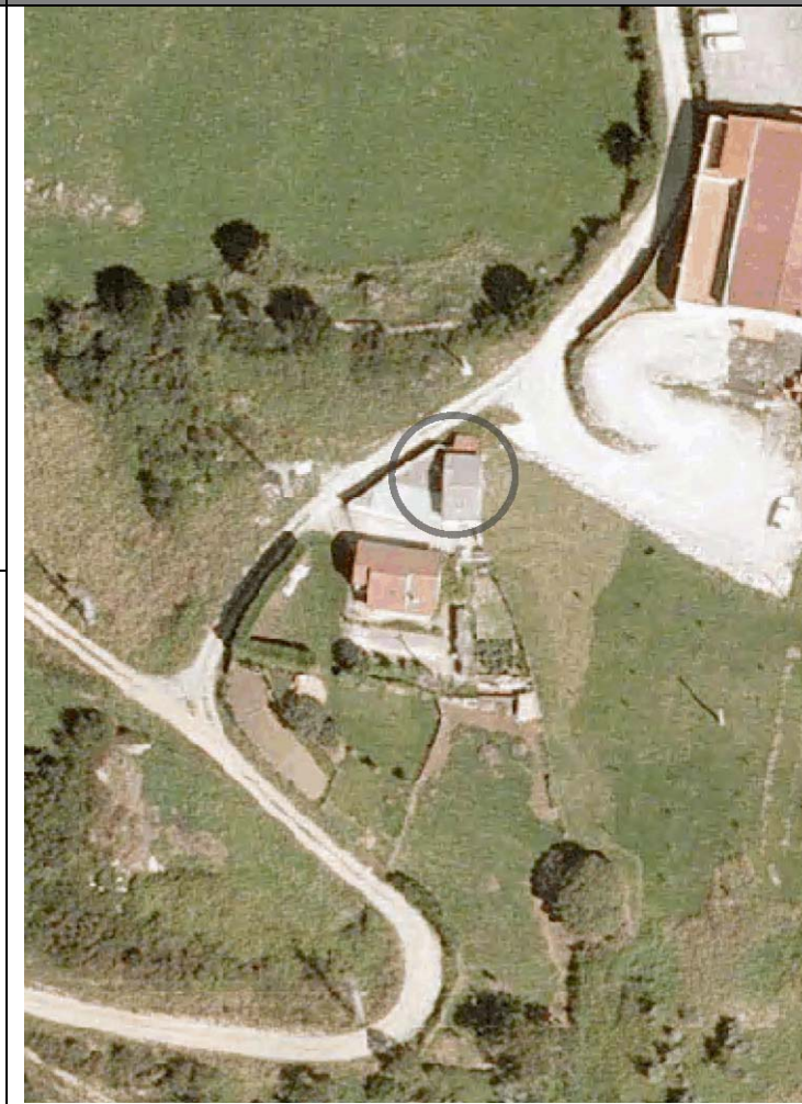
Plan Nacional de Ortofotografía Aérea ( PNOA 2007 ). E:1/1000