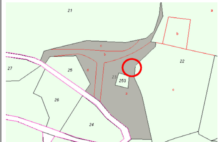
Plano de Catastro (Junio2010). E: 1/2000