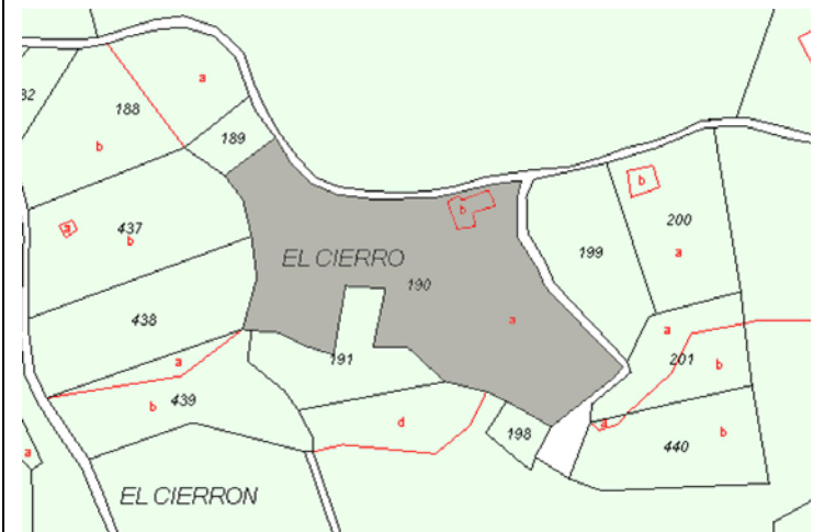
Plano de Catastro (Junio 2010). E: 1/5000