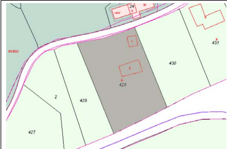
Plano de Catastro (Junio2010). E: 1/2000