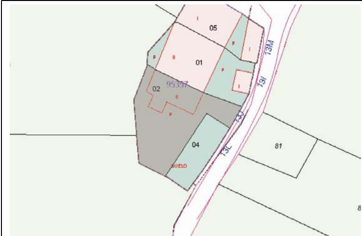
Plano de Catastro (Junio2010). E: 1/1000