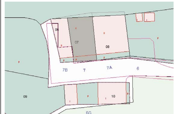
Plano de Catastro (Junio 2010). E: 1/500