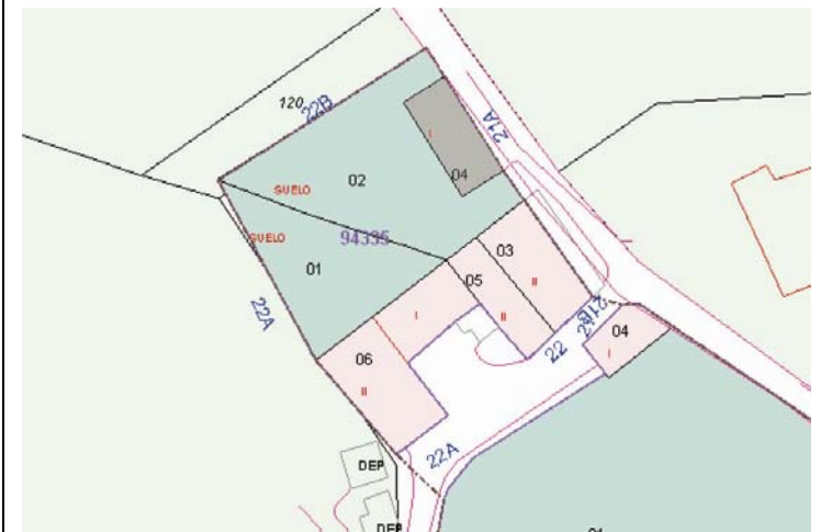
Plano de Catastro (Junio2010). E: 1/1000