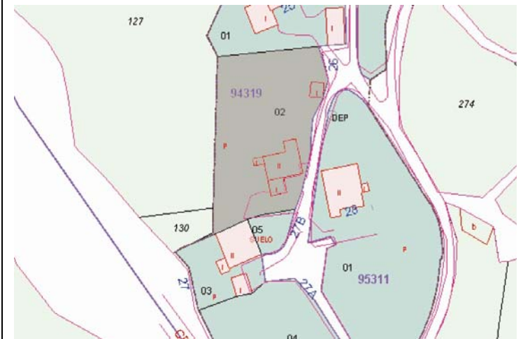
Plano de Catastro (Junio2010). E: 1/2000