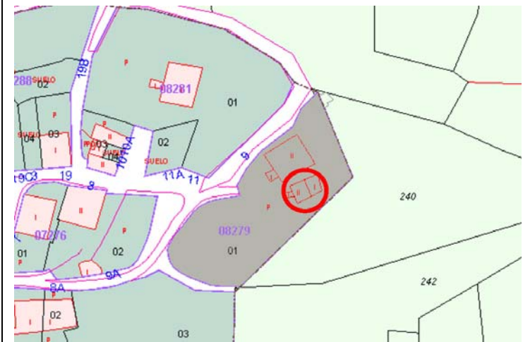
Plano de Catastro (Junio2010). E: 1/2000