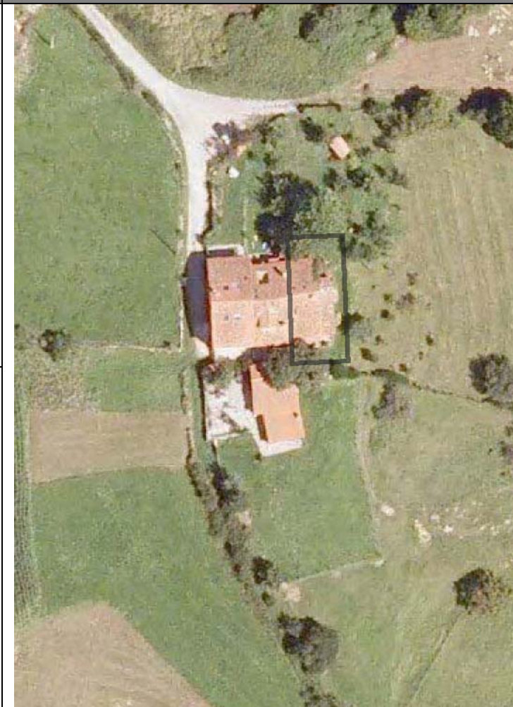
Plan Nacional de Ortofotografía Aérea ( PNOA 2007 ). E:1/1000