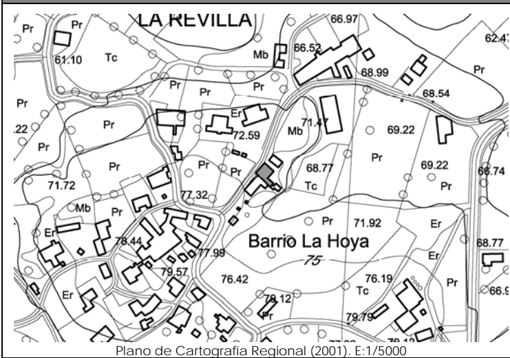
Plano de Cartografía Regional (2001). E:1/5000