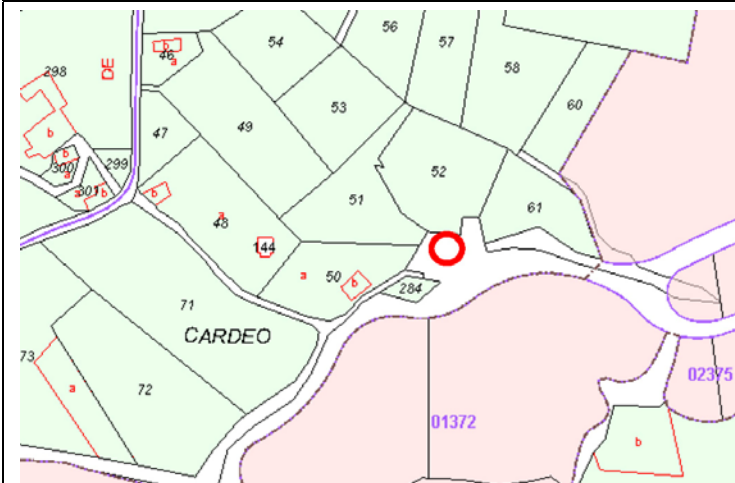
Plano de Catastro (Junio2010). E: 1/5000