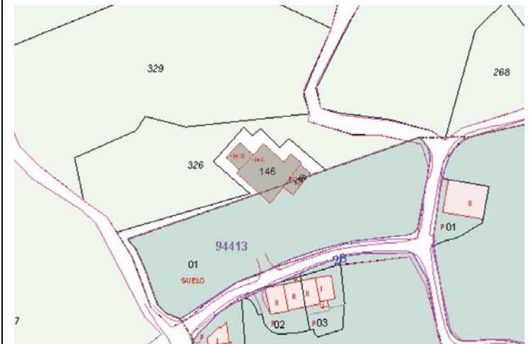
Plano de Catastro (Junio2010). E: 1/2000