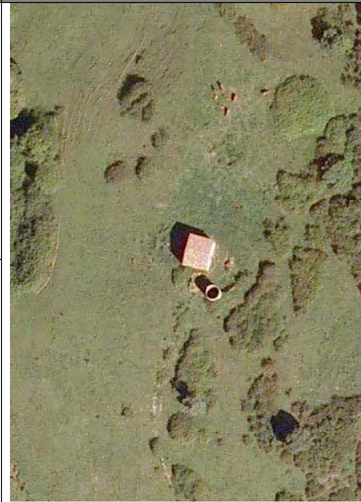
Plan Nacional de Ortofotografía Aérea ( PNOA 2007 ). E:1/1000