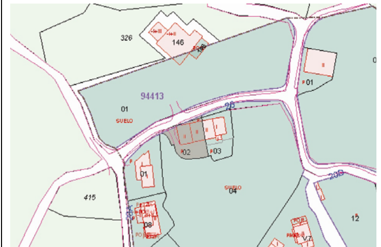
Plano de Catastro (Junio 2010). E: 1/2000