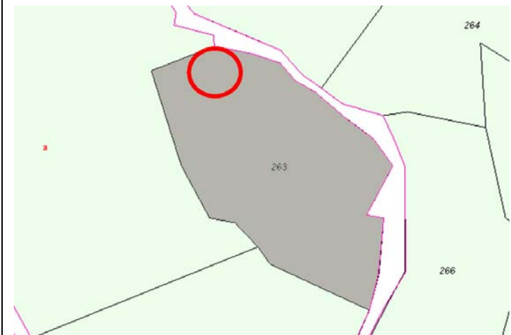
Plano de Catastro (Junio2010). E: 1/2000