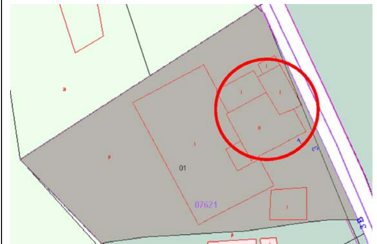
Plano de Catastro (Junio2010). E: 1/1000