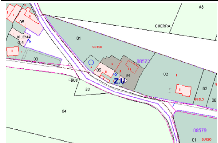
Plano de Catastro (Junio2010). E: 1/2000