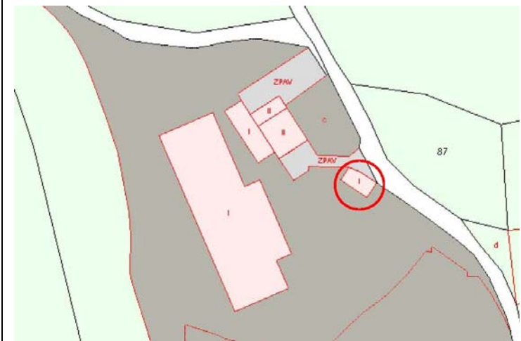
Plano de Catastro (Junio2010). E: 1/2000