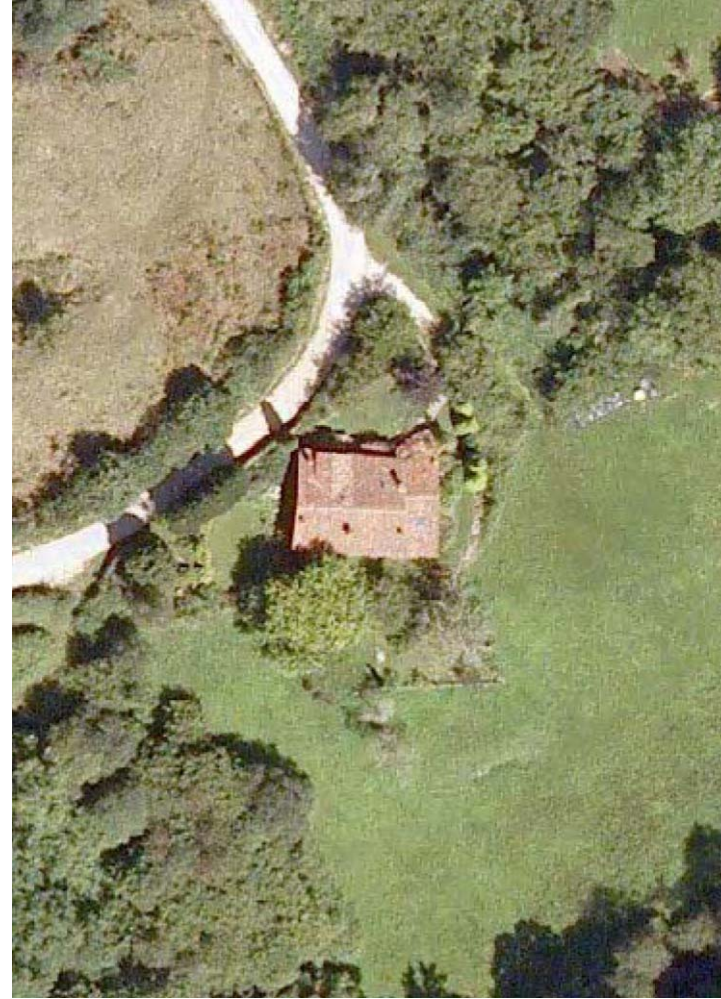
Plan Nacional de Ortofotografía Aérea ( PNOA 2007 ). E:1/1000