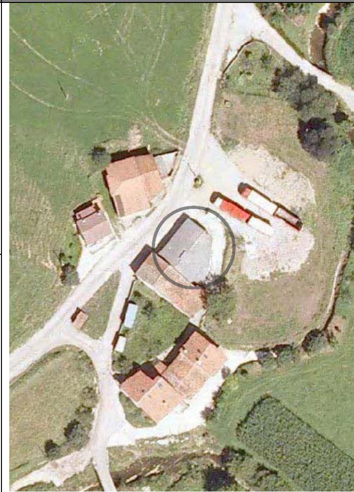
Plan Nacional de Ortofotografía Aérea (PNOA 2007). E:1/1000