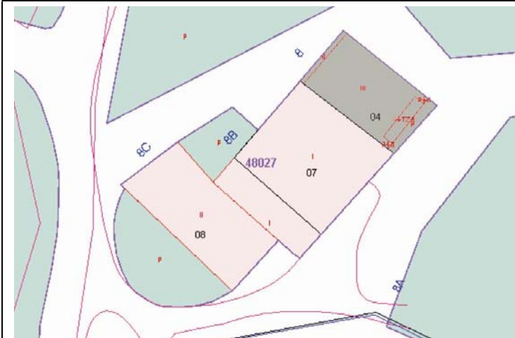
Plano de Catastro (Junio 2010). E: 1/500