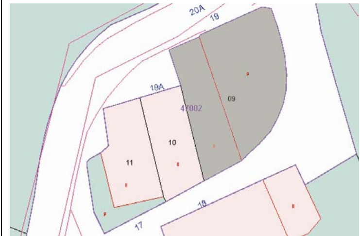
Plano de Catastro (Junio2010). E: 1/500