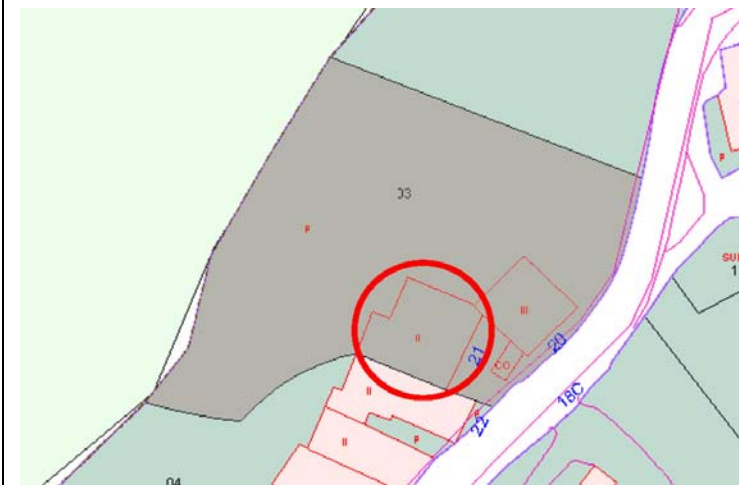
Plano de Catastro (Junio2010). E: 1/1000