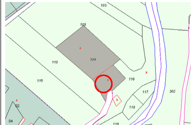
Plano de Catastro (Junio2010). E: 1/2000