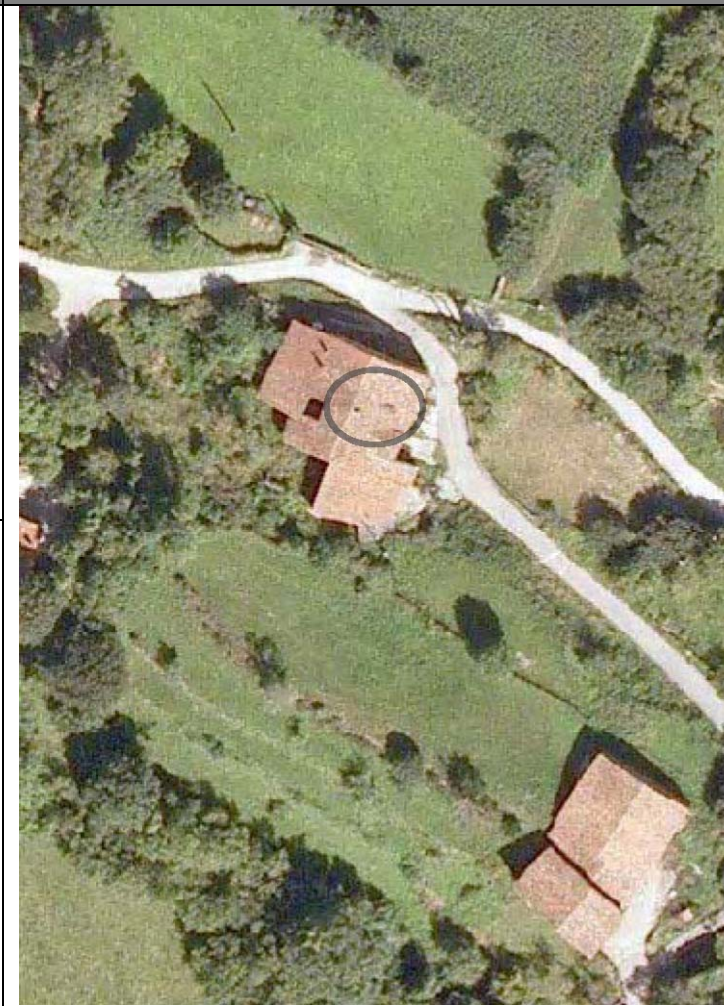
Plan Nacional de Ortofotografía Aérea ( PNOA 2007 ). E:1/1000