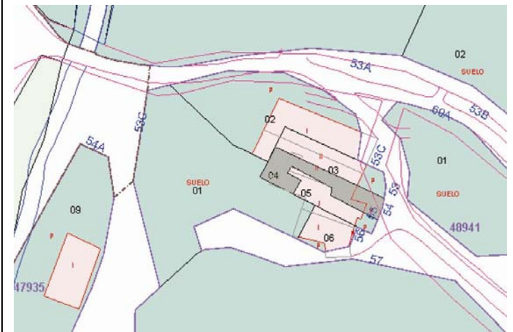
Plano de Catastro (Junio2010). E: 1/1000