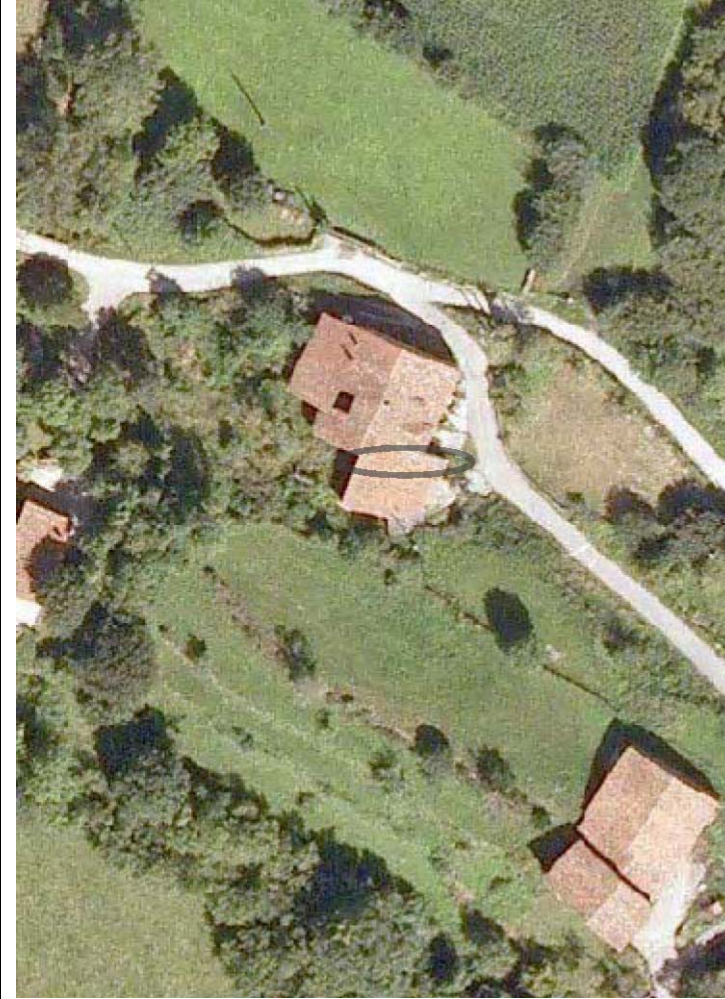
Plan Nacional de Ortofotografía Aérea ( PNOA 2007 ). E:1/1000