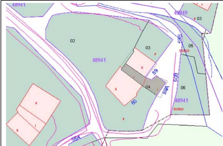
Plano de Catastro (Junio2010). E: 1/1000