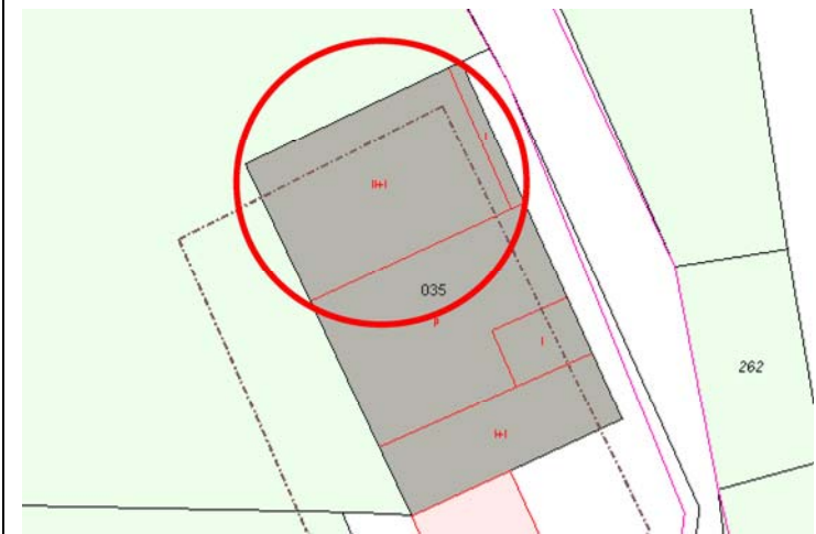
Plano de Catastro (Junio2010). E: 1/500