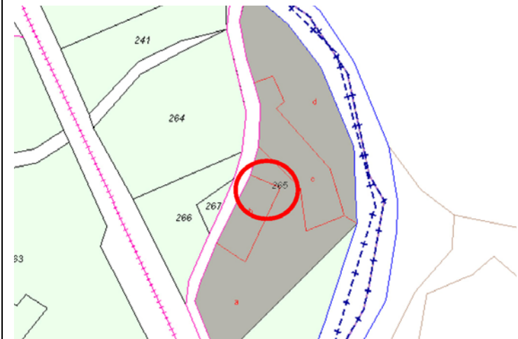
Plano de Catastro (Junio2010). E: 1/2000